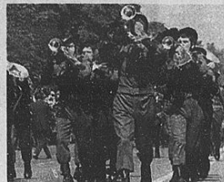
Biella ospita il 47° raduno nazionale dei fanti piamati, appuntamento che cade nel bicentenario della nascita del fondatore, il generale Alessandro La Marmora

Molte le manifestazioni di contorno E domenica si tiene la grande parata