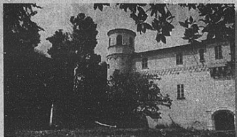
Accanto, il Castello di Oiasco circondato da un parco all'inglese, a destra, il Castello di Guarene

Le visite anche in dimore private sono riservate a gruppi da 30 a 100 persone